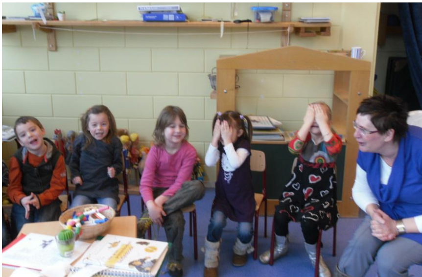
De leerkracht is in staat om onderwijs te laten beleven...

Als team bespreken we ontwikkelingen en aandachtspunten. Open communicatie is nodig om goed te kunnen evalueren. We willen al het reilen en zeilen binnen onze school open en eerlijk met elkaar bespreken. Daarom is ook ons leerkrachtgedrag aan evaluatie onderhevig. Dit evalueren kan gebeuren door de schoolleiding, maar ook door elkaar. Hierbij is positieve feedback en kritiek geven steeds de insteek die gekozen wordt.